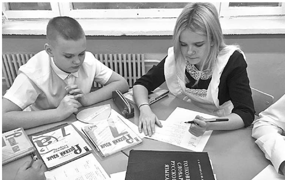
Единый методический день в школе № 17 г. Губкина