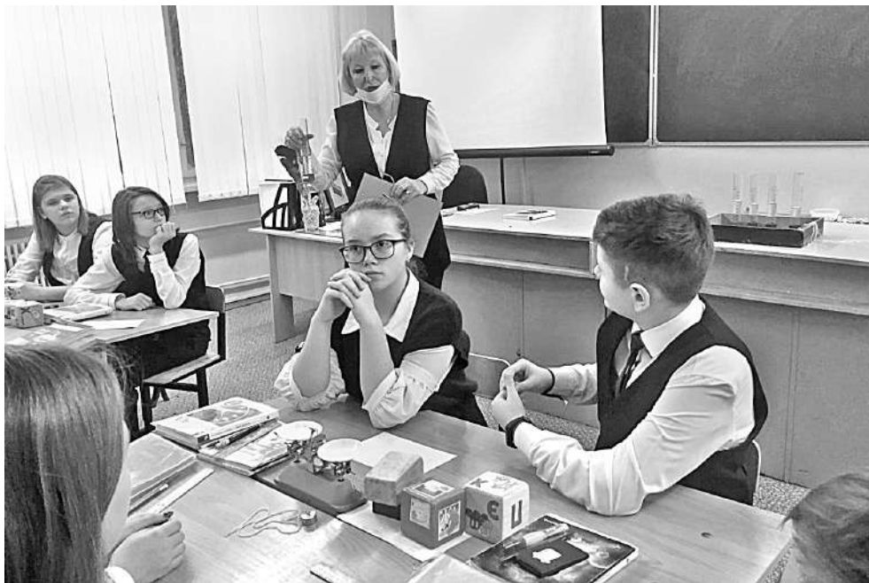
Открытый урок в школе № 17 г. Губкина

— Я посмотрел фильм «Чернобыль» и захотел выяснить, почему произошла такая авария, кто виноват, можно ли было избежать трагедии. Когда работал над темой, столкнулся с тем, что нужно очень много знать, чтобы понять даже самые простые ве-