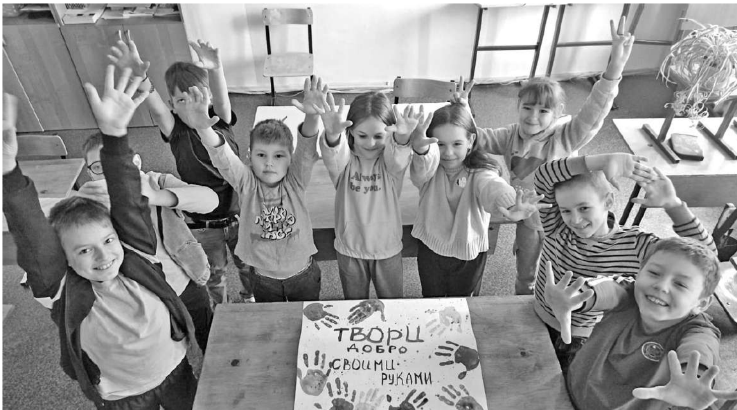
Весёлые младшеклассники школы № 13 г. Губкина

Сейчас часто можно встретить термин — «массовая школа». И педагоги, и родители понимают его по-разному. Одни считают, это самая обыкновенная школа для обычных, неодарённых детей. Другие — это школа, в которой учат по принципу «лишь бы получить аттестат». Третьи... Впрочем, что гадать? Давайте узнаем у учителей и директоров белгородских школ, что для них означает понятие «массовая школа» и как к нему относиться.