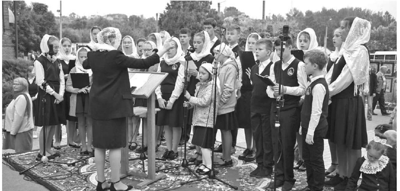
Хор православной гимназии № 38 г. Старый Оскол

МИССИЯ УЧИТЕЛЯ. Лицей № 3 — это школа, в которой интересно учиться детям и интересно работать учителям. Это учреждение, где активно используются и традиционные, хорошо зарекомендовавшие себя методы обучения, и самые современные информаци-