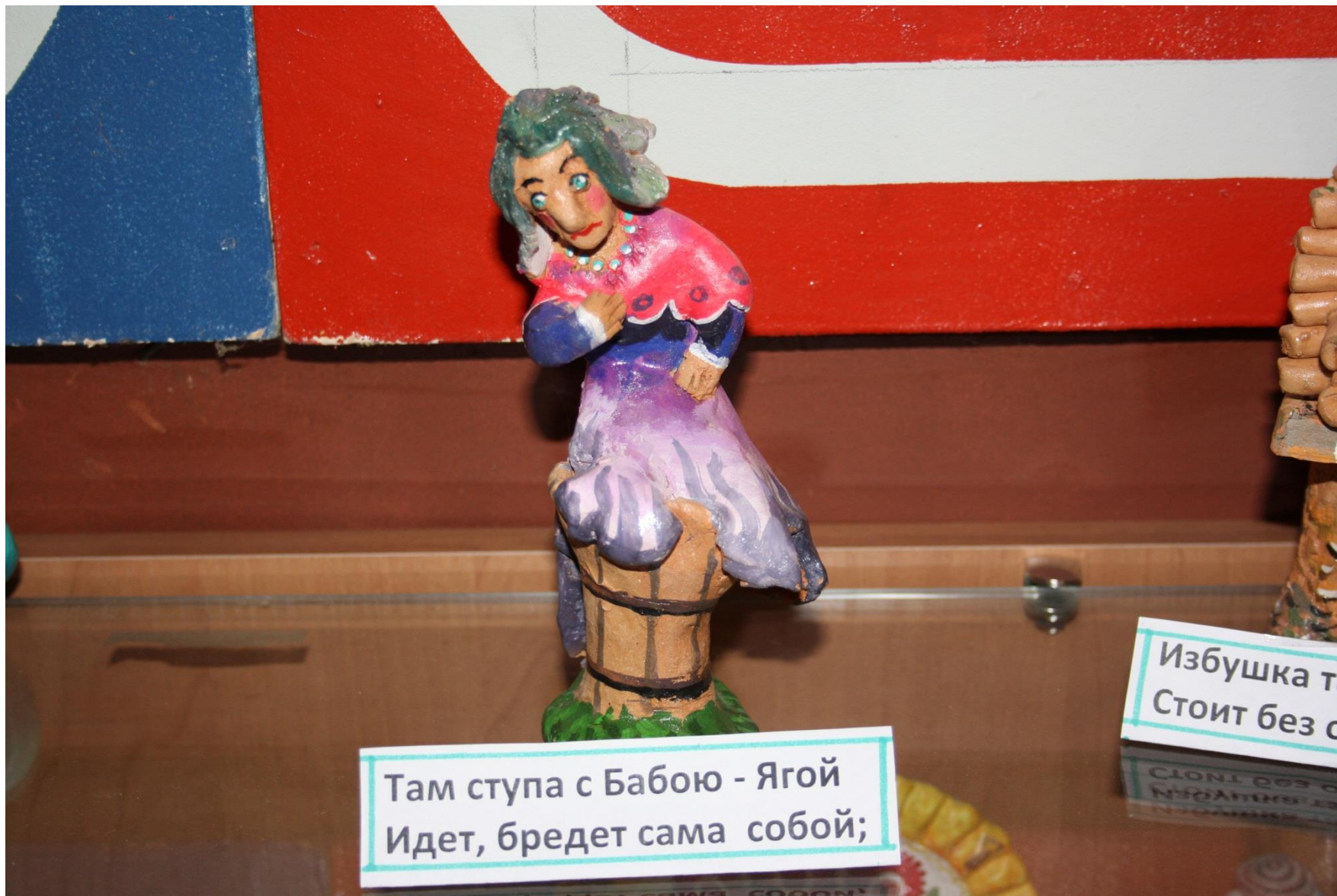
Там ступа с Бабою - Ягой Идет, бредет сама собой;