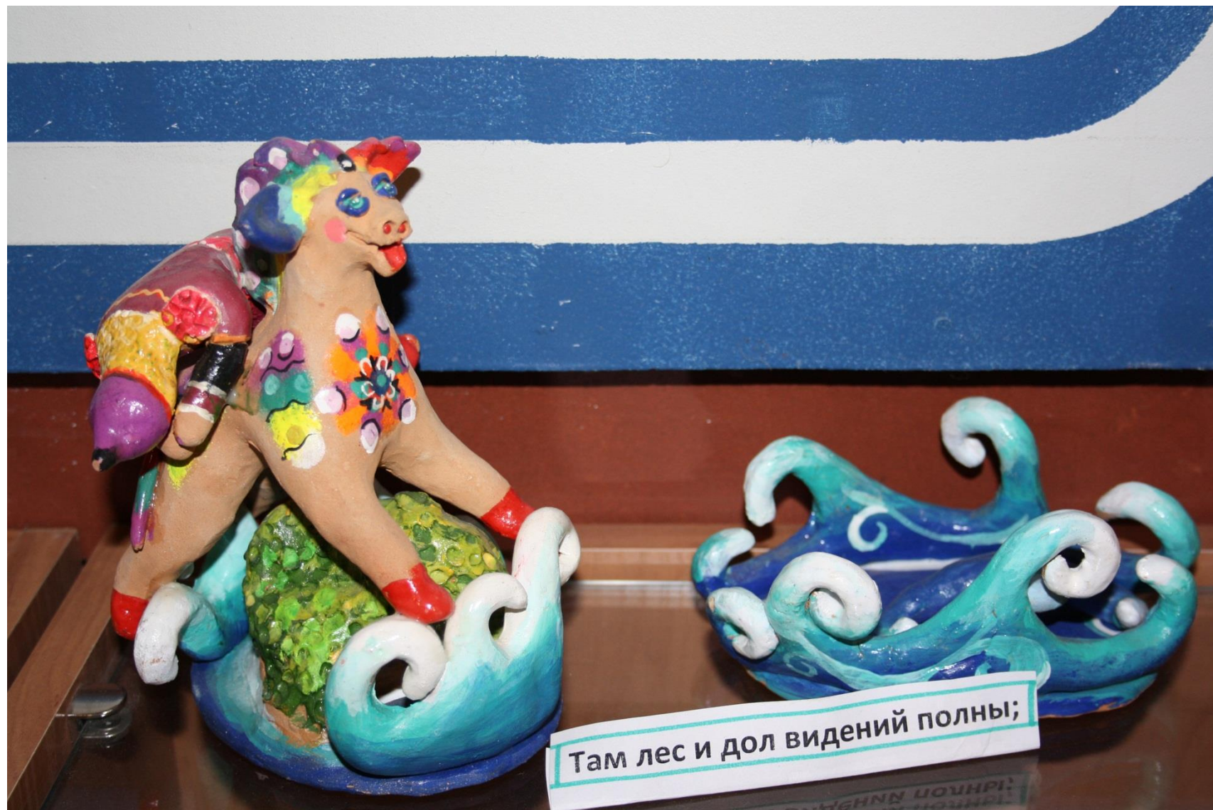
Там лес и дол видений полны;