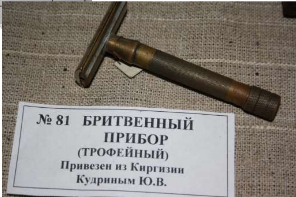
№ 81 БРИТВЕННЫЙ ПРИБОР (ТРОФЕЙНЫЙ) Привезен из Киргизии Кудриным Ю.В.