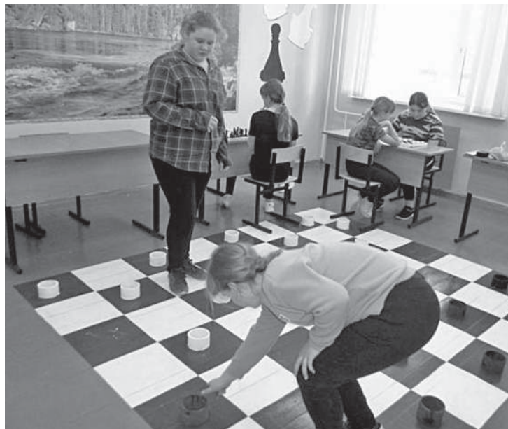
Игровая зона в Глинской школе