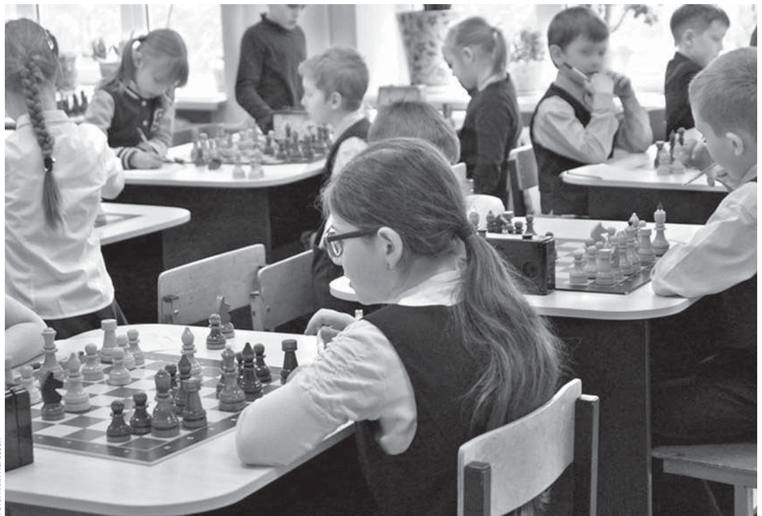
В образовательном комплексе «Луч»

— Высокий уровень локального нормотворчества. В этих учебных заведениях есть хорошо проработанные локальные нормативные акты, которые обеспечивают порядок. Основные образовательные программы и программы развития направлены на активное познание мира, развитие учебно-исследова-