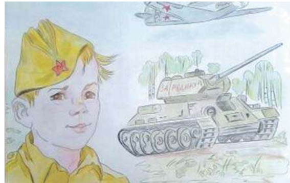
Рисунок Дарьи Лопиной (Корочанская школа им. Д. Кромского)