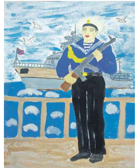
Моряк. Рисунок Анатолия Черняева (Графовская школа Шебекинского горокруга)

Ульяна Самадь, ученица Бессоновской школы Белгородского района