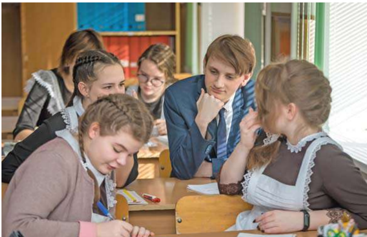
Урок обществознания в 10-м «Б» классе

Ольга МУШТАЕВА » ТЕКСТ