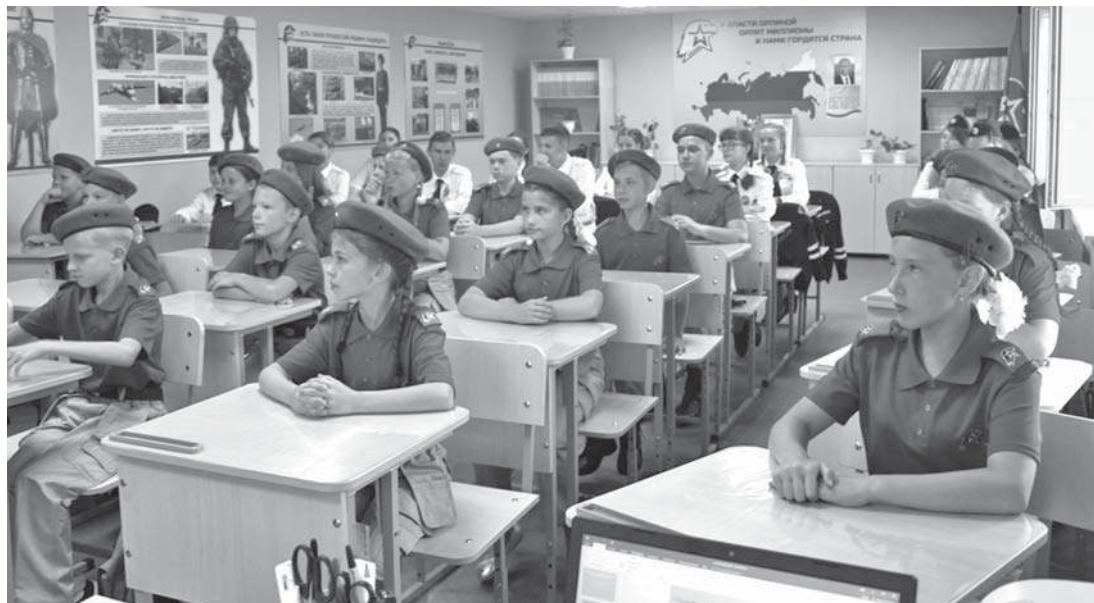
Кадетский класс школы № 1

В результате реализации проекта в школе создана лаборатория, которую можно без преувеличения назвать кузницей пытливых, талантливых юных исследователей. Ученики от четвертого до выпускного классов занимаются наукой. В рамках постпроектной деятельности рядом с лабораторией оформлена развивающая зона «Химия занимательная и увлекательная», которая рассказывает об опытах,