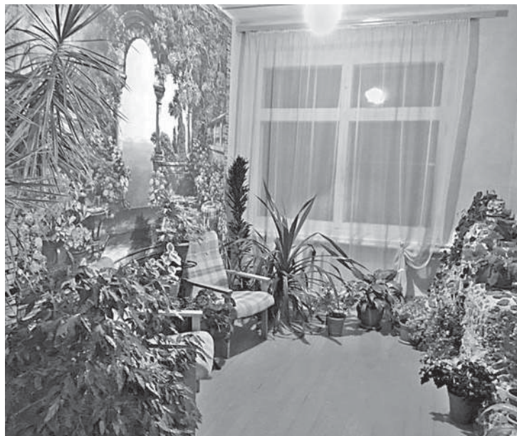
Зимний сад в Васильдовской школе