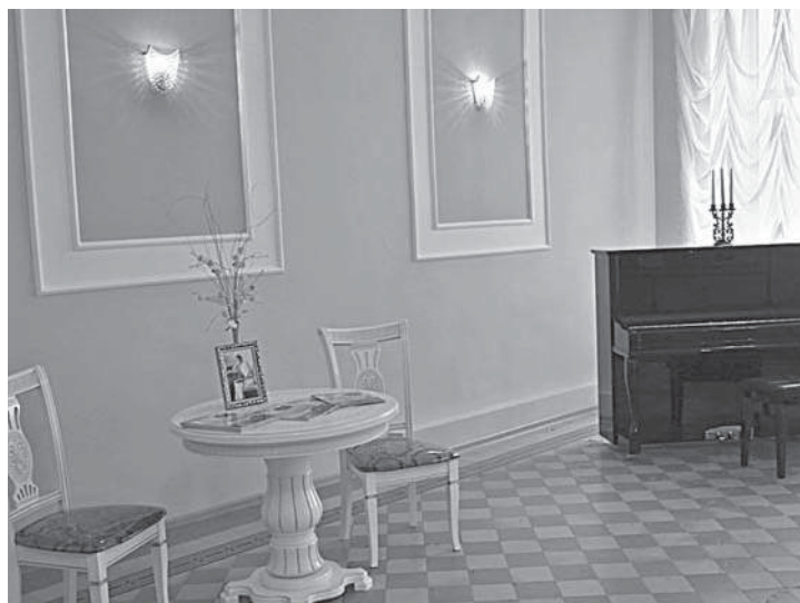
Ольгинский зал школы № 1