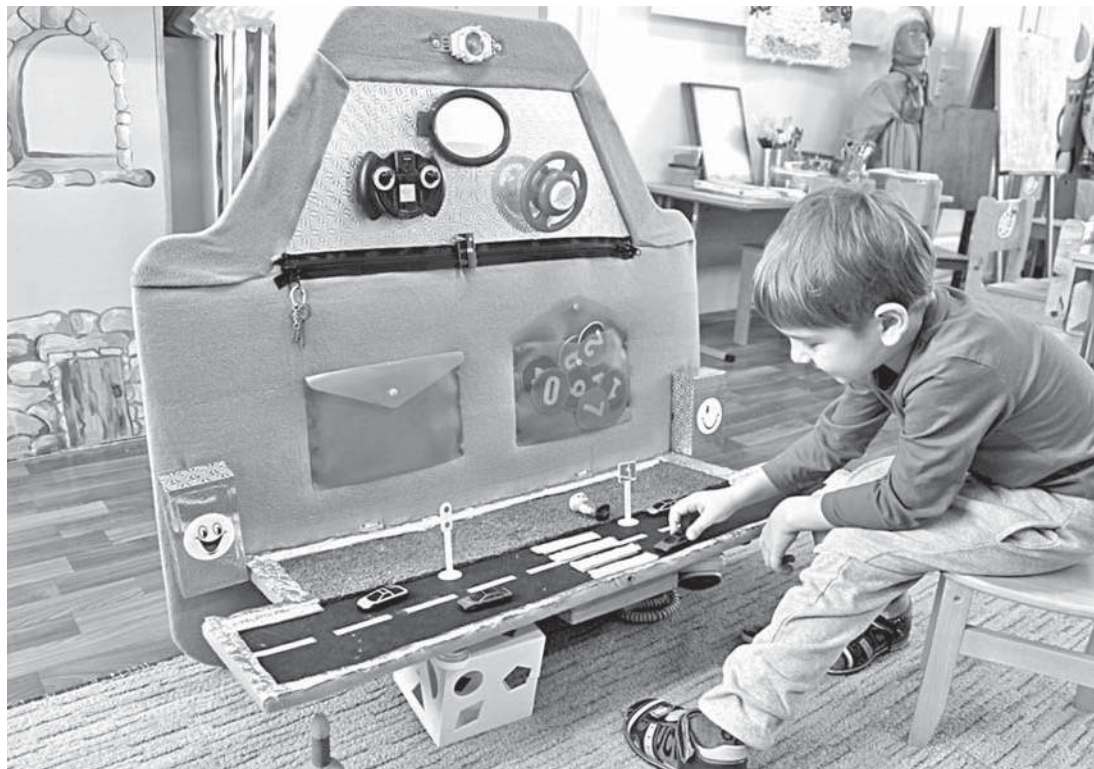
Игровая зона в детском саду № 8

СЕГОДНЯ СВОИМ ОПЫТОМ ДЕЛЯТСЯ УЧРЕЖДЕНИЯ ОБРАЗОВАНИЯ НОВООСКОЛЬСКОГО ГОРОДСКОГО ОКРУГА