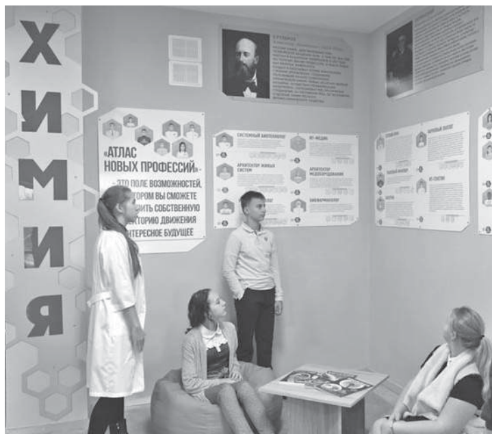
Профориентационная зона в школе № 1