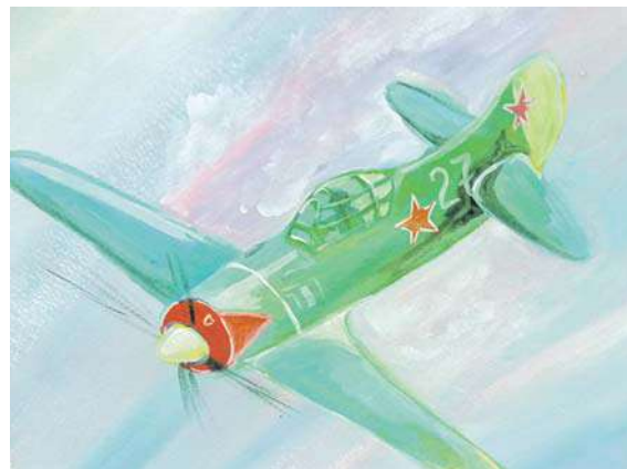
Воздушный бой. Рисунок Дмитрия Новикова (Корочанская школа им. Д. Кромского)