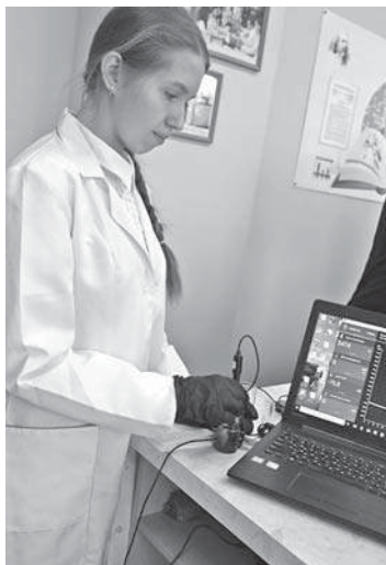
В школе № 1

КОЛЛЕГИ! МЫ ПРИГЛАШАЕМ ВАС СТАТЬ НЕ ТОЛЬКО ЧИТАТЕЛЯМИ, НО И АВТОРАМИ ГАЗЕТЫ!