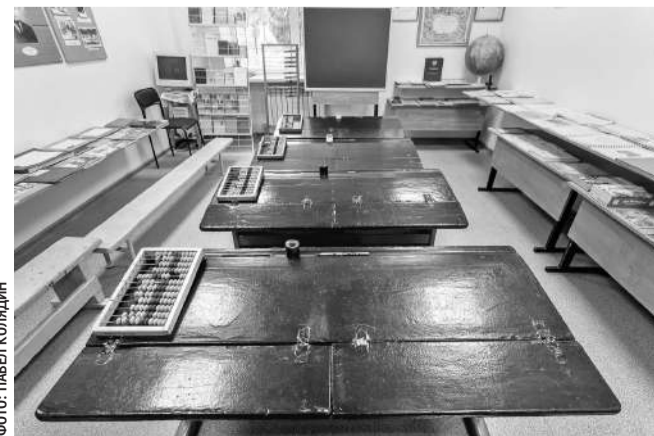
Зал истории образования в музее Томаровской школы № 1

С тех пор все уроки русского языка, литературы и беседы о советском обществе проходили без курьёзов. Молоденькая учительница даже съездила в областное управление кинофикации. Договорилась каждую неделю по пятницам привозить в колонию фильмы.