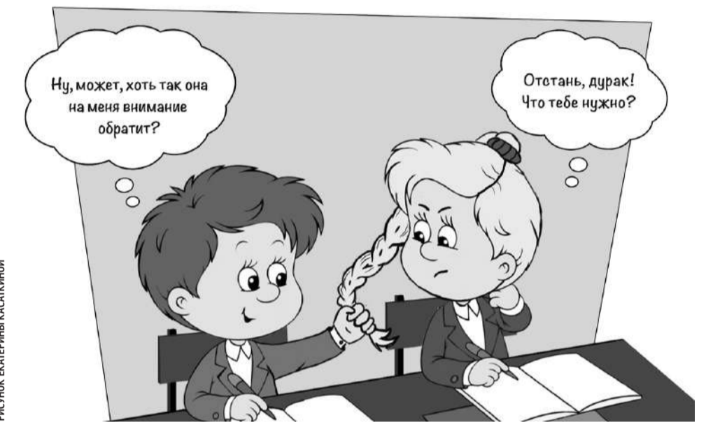
РИСУНОК ЕКАТЕРИНЫ КАСАКИНОЙ

Наши подростки переживают чувства влюблённости, первой любви, дружбы — это прекрасные человеческие чувства и отношения,