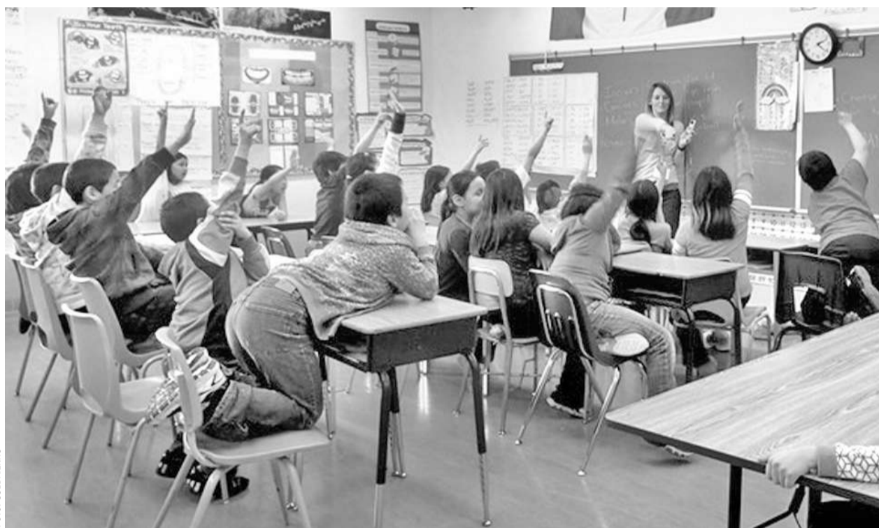
Занятия в одной из канадских школ